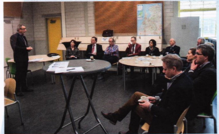
In gesprek met de fondsen