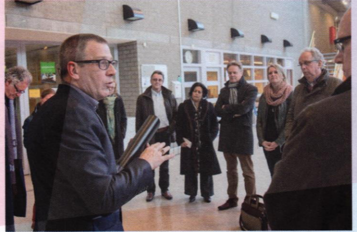
Rondleiding door directeur PI Lelystad